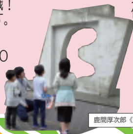
鹿間厚次郎《静の旋律 No.31》